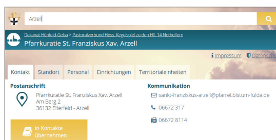
Webseite des Bistums Fulda